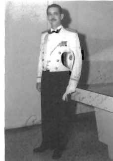
Para mi hija de mi alma, con la ilusión honda de quien espera la felicidad de su pequeña. Besos de Papi. Sept. 28, 1955